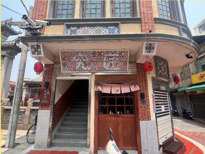
比賽場地入口實景